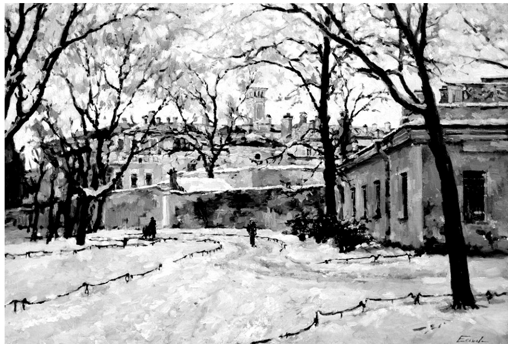
Фото картин с выставки предоставлены Павлом Еськовым