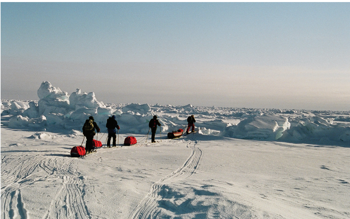
На пути к Северному полюсу