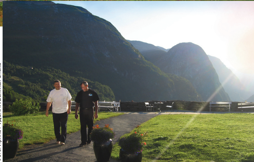
Из 50 самых красивых видов на планете Сталхеймская долина Норвегии занимает 14 место