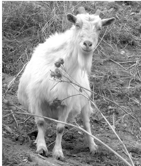
Коза Милка — любимица хозяйки

считали их за кулаков. Сослали в Иркутскую область сначала на лесоповал, а потом на кирпичный завод. Весь поселок был из сосланных, жили бедно, ни у кого скотины не было, только моя тетушка козу держала. И я, когда на пенсию пошла, решила, что буду коз разводить. Благо еще остались воспоминания, как надо за ними ухаживать. Выгуливаю коз каждый день в любую погоду по несколько часов.