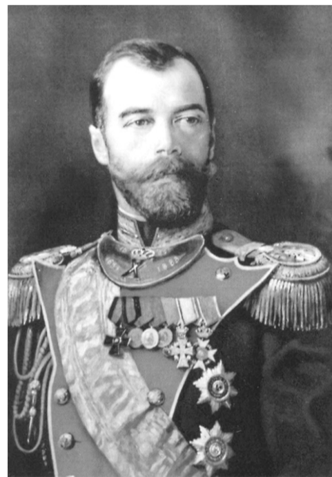
Император Николай II

Победы, в общем-то, местные и незначительные, достигались японцами за счет больших потерь. В сражении под Ляояном, произошедшем в августе 1904 года, японцы потеряли 24 тысячи солдат и офицеров.