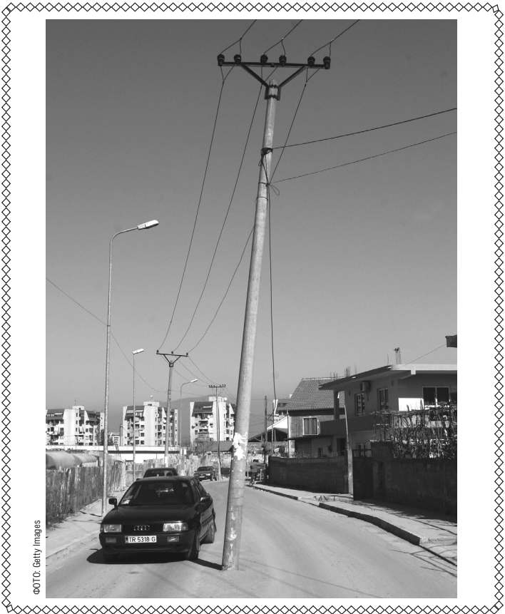
В столице Тирана Республики Албания. Улица единственная в своем роде

Мнение редакции может не совпадать с мнением авторов. За содержание рекламы редакция ответственности не несет.