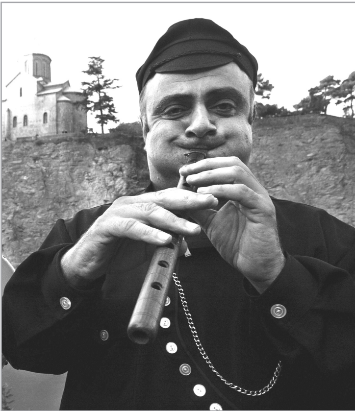
Грузия. Воодушевленный музыкант на празднике, посвященном городу Тбилиси

Мнение редакции может не совпадать с мнением авторов. За содержание рекламы редакция ответственности не несет.