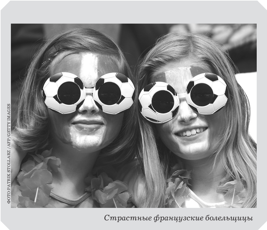
Страстные французские болельщицы

По горизонтали: 3. Погода. 5. Курорт. 8. Роу. 10. Стеллаж. 11. «Квартет». 12. Париж. 13. Москва. 15. Навлон. 17. Апалачи. 21. Триполи. 23. Калория. 25. «Татра». 26. Смыслов. 27. Нагорье. 29. «Арзамас». 32. Вагант. 35. Надсон. 37. Фобос. 38. Прогноз. 39. Ядерщик. 40. Или. 41. Лоцман. 42. Нейлон. По вертикали: 1. Ограда. 2. Болван. 3. Полок. 4. Аркада. 5. Кулиса. 6. Туров. 7. Отворот. 9. «Сегодня». 14. Веспасиан. 16. Антоновка. 18. Притвор. 19. Лактоза. 20. Чеканка. 22. Рим. 24. Инь. 26. Суматра. 28. Европий. 30. Злобин. 31. Миозин. 33. Алгол. 34. Троица. 35. Неделя. 36. Дёрен.