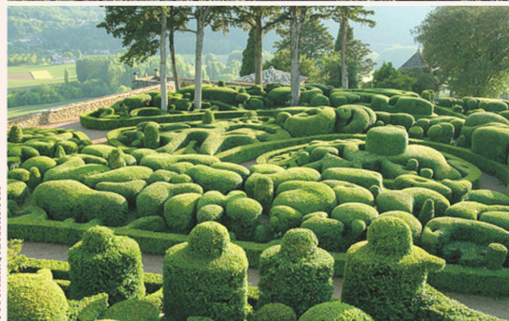
Шедевры ландшафтного искусства – сады Маркессак

ми» он добавил новый штрих – клумбы розмарина и сантолины (вида полыни), придавших