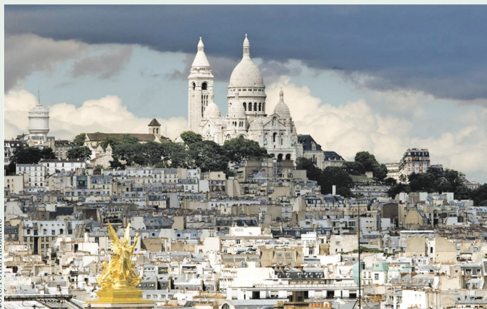
Рассказывать о Монмартре ... это то же самое, что описывать красоту женщины. Его надо видеть

И над всем возвышается ярко освещенный собор Сакре-Кёр (Sacre Coeur). Со своими стройными белыми куполами он, как и Эйфелева башня, является одной из главных достопримечательностей города. Его уникальное расположение – высоко над городом – позволяет любоваться Парижем, искрящимся в колдовском свете, и испытать ощущение, что здесь, на высоте Монмартра, все затаенные желания исполняются. Воистину, во Франции можно почувствовать себя богом.