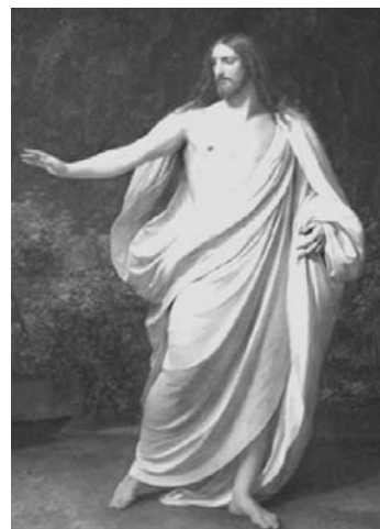
Иисус христос кисти Александра Иванова

Он был очарован понятием Троицы, и видел три личности, встроенные во временную структуру процесса человеческого совершенствования... Ио-