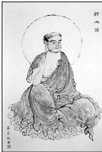
Будда Шакьямуни кисти Чжан Цуйин

...Это будет время, когда верующие будут бесправны и бес-