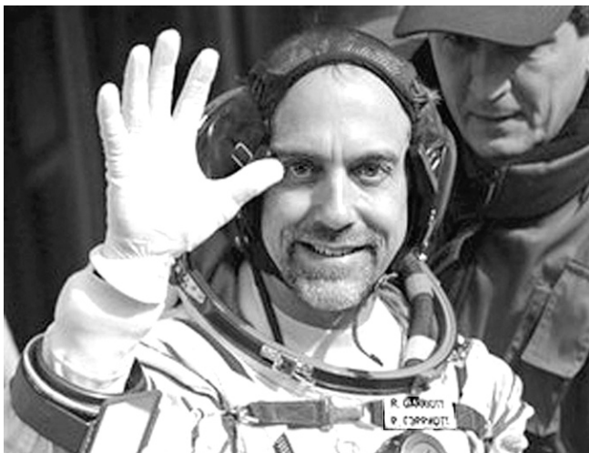
Ричард Гэрриот – космический турист

Предполагается, что космический турист Ричард Гэрриот (сын астронавта NASA Оуэна Гэрриота) пробудет на МКС 10 дней и вернется на Землю в конце октября вместе с Сергеем Волковым и Олегом Кононенко, которые в дан-