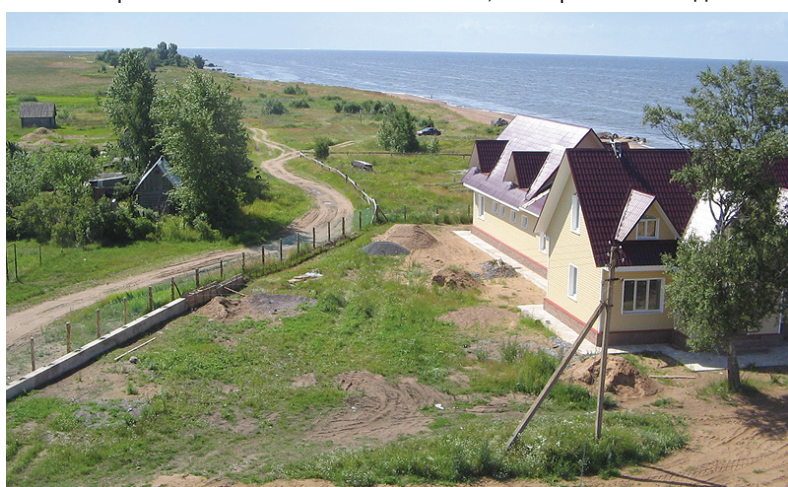
Дома в деревне Ветвеник слышат непрерывный шум прибоя Чудского озера