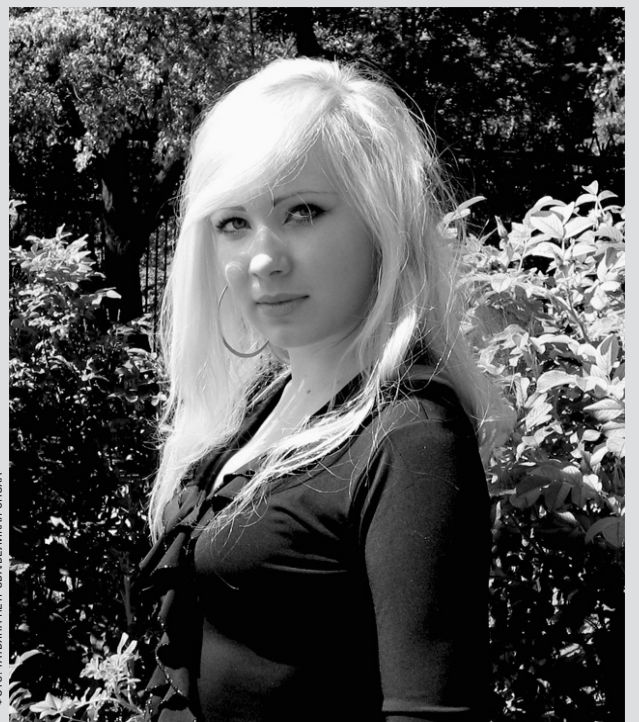
ФОТО: ТАТЬЯНА ПЕТРОВАВЕЛИКАЯ ЭПОХА

«Сейчас я на жизнь смотрю совсем другими глазами. «Про-