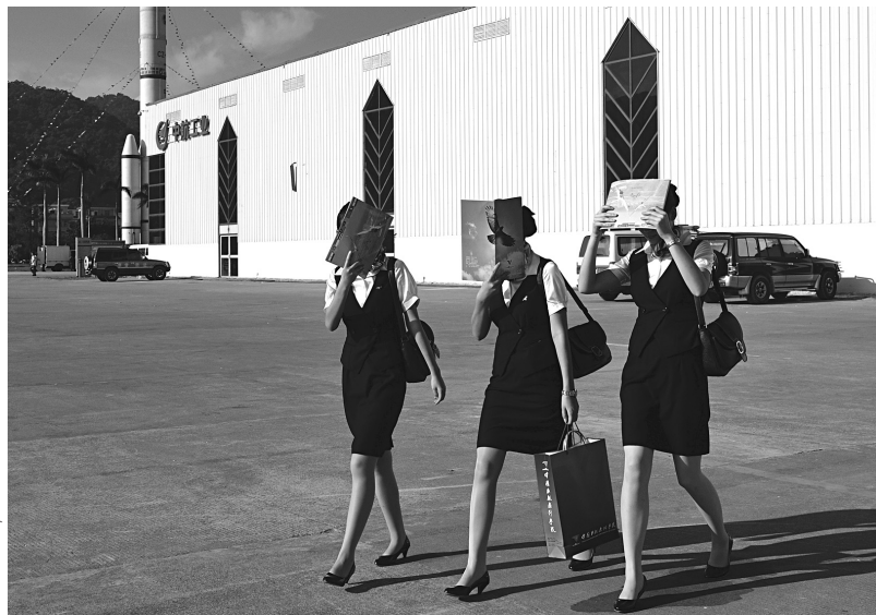
Такое палящее солнце!

По вертикали: 1. Шахтная печь для плавки чугуна. 2. Рассказ Василия Шукшина. 3. Здание, помещение для экспонатов на выставке. 5. Трава семейства розоцветных, медонос. 6. Польский народный танец. 8. Гетероциклическое соединение. 11. Самоуправление, административная независимость православных церквей. 12. Грубая плотная водозащитная ткань. 14. Молитвенные стихи и песнопения православной церкви. 16. Табак, махорка. 17. Азербайджанское блюдо. 22. Город в Московской области. 24. Вулкан в Центральной Америке. 25. Литератор. 26. Продовольствие. 27. В Древней Греции выборное должностное лицо, следившее за благоустройством и порядком мест торговли.