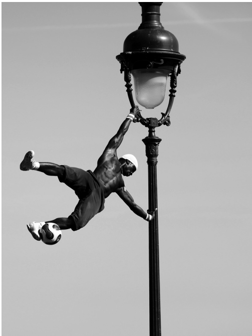
Париж. Трюкач на уличном фонарном столбе