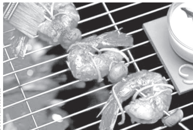
Аппетитные жареные креветки с соусом из кокосового рома