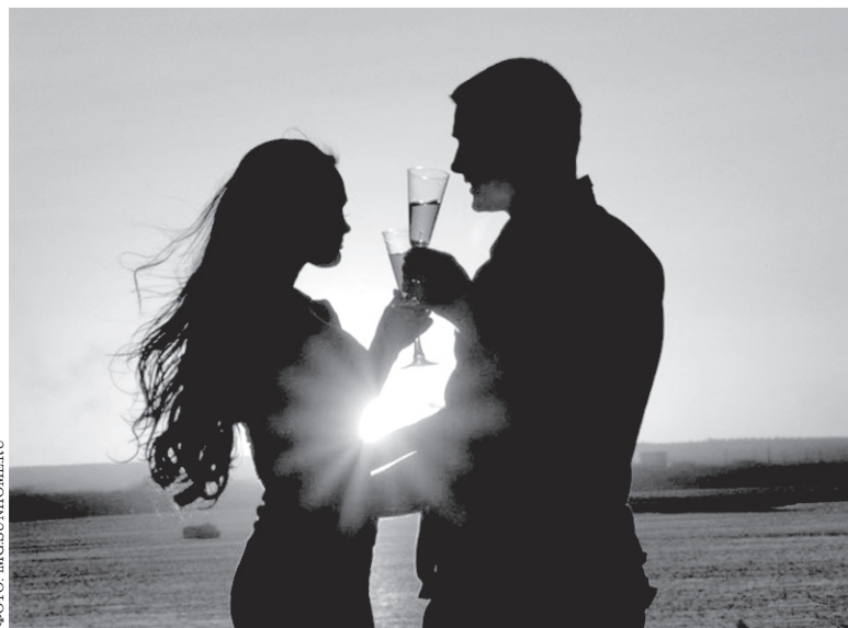
Пожертвовать чем-то личным для счастья и покоя возлюбленного – это и есть плод настоящей любви

Но жизнь, к сожалению, не так однозначна. Человеку, особенно в наши сумбурные времена, часто хочется снова испытать безумие