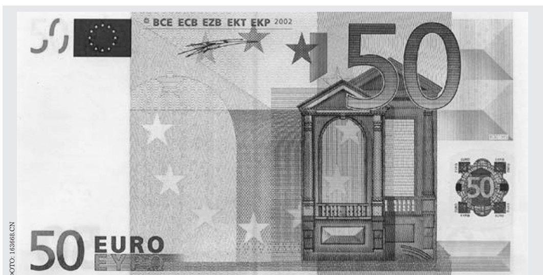
ФОТО: 163668 CN